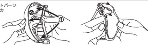
ガスケットパーツ の取付け方